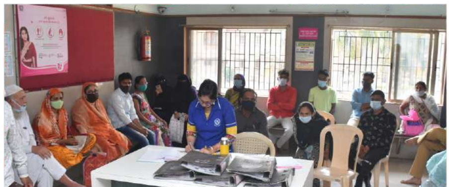
Patients During Camp